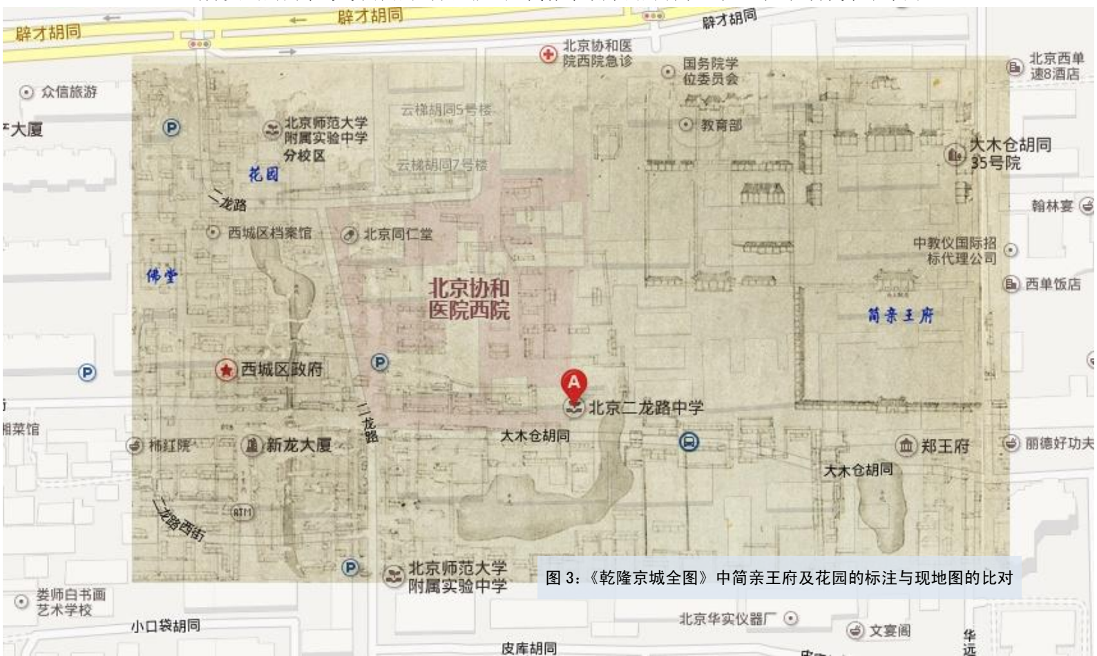
图 3：《乾隆京城全图》中简亲王府及花园的标注与现地图的比对

《乾隆京城全图》九排十图中，可见到几个名为“水坑”的标注。在元代，这一带曾是玉河分支出的两条弯弯曲曲的河汉，靠近元代郭守敬开掘的引水工程金水河。明代永乐年间，