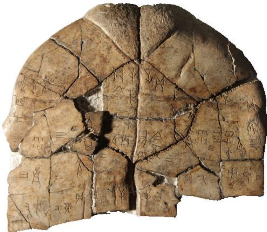
图 1：北图 5396 甲骨

北图 5396 号（图 2），即《甲骨文合集》14295 号的上半部分，是属于武丁时期的刻辞，为祈年卜辞。释文如下：