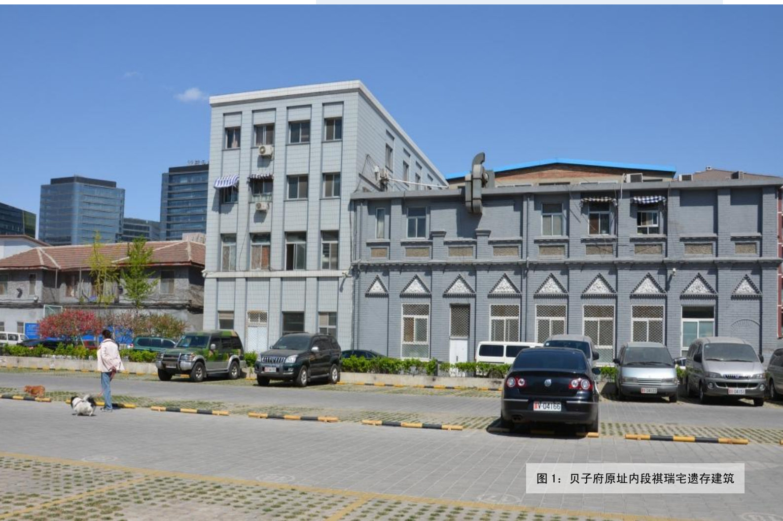
图 1：贝子府原址内段祺瑞宅遗存建筑

固山贝子弘昞府是康熙第二十二子恭勤贝勒胤祜之子弘昞的府邸，胤祜于雍正八年二月(1730)封贝子，雍正十二年二月晋贝勒。乾隆八年(1743)卒，谥曰恭勤。胤祜的长子弘昞于乾隆九年袭贝子，乾隆四十九年卒。《乾隆京城全图》绘制期间该府居者为恭勤贝勒的儿子固山贝子弘昞，所以图中标注为固山贝子弘昞(府)。