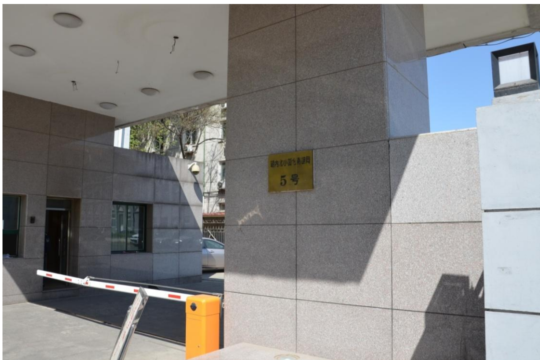
图 4：仓南胡同 5 号院