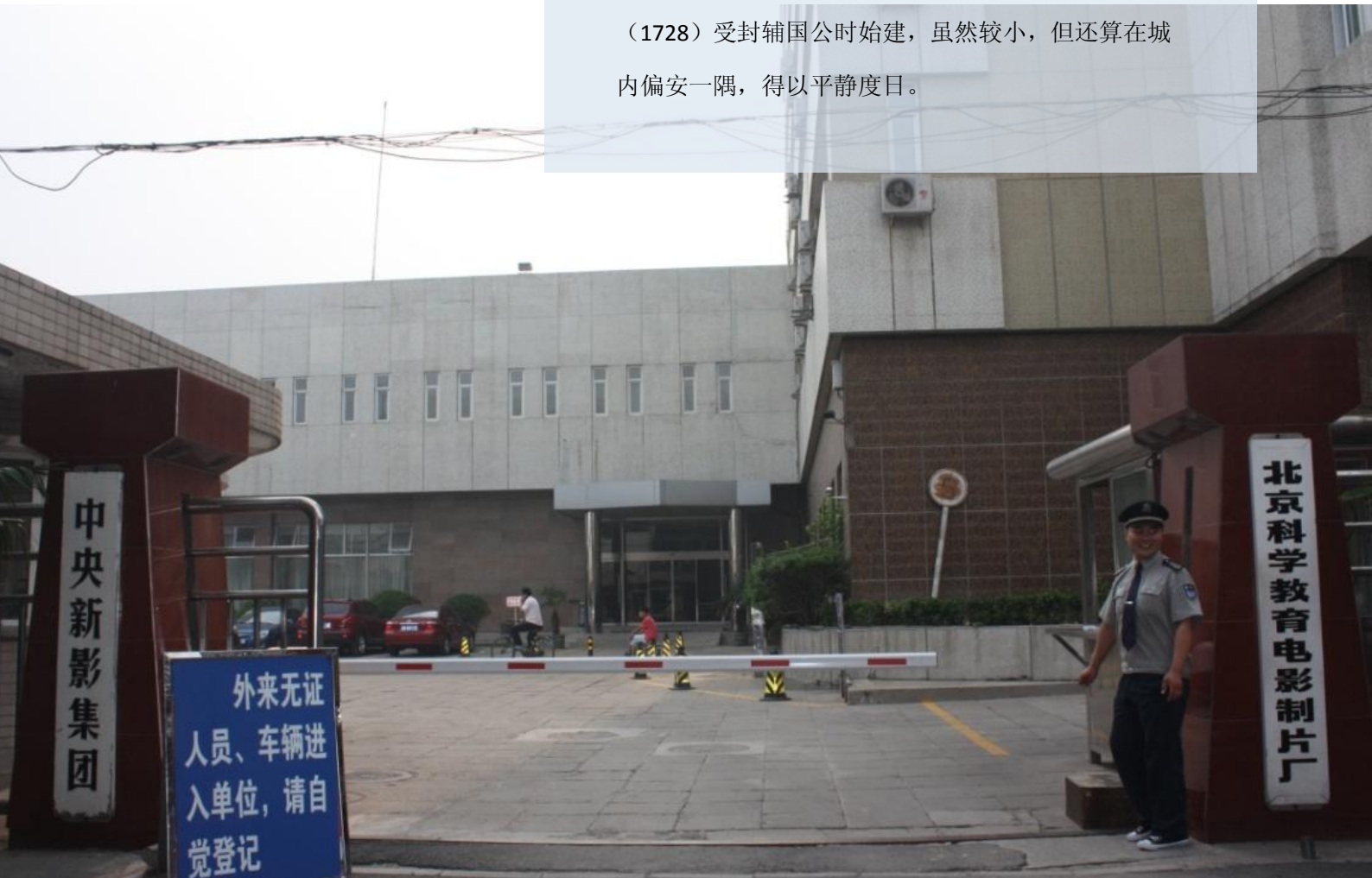
图1：今辅国公弘曺旧址上的北京科学教育电影制片厂

《乾隆京城全图》第3排第9图什刹海水域西侧有一片宅邸，其中较小的那座便是辅国公弘曺宅。弘曺是康熙朝废太子允礽的第六子，在雍正登基之后下令废太子一家由北新桥王大人胡同王府（参见《乾隆京城全图》第2排第2图）迁至昌平郑家庄，其中包括后来承袭允礽爵位的次子、弘曺的兄长——弘皙。此时的弘曺年仅十岁，虽未见记载，但也应随父兄迁去。直至乾隆四年（1739），弘皙因谋逆被削爵，允礽十子弘勳袭郡王才搬回北新桥的理郡王府。而弘曺一直未参与到皇位争夺之中，其府应为雍正六年（1728）受封辅国公时始建，虽然较小，但还算在城内偏安一隅，得以平静度日。