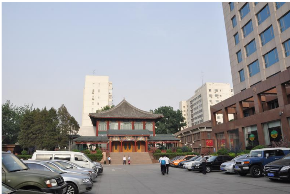
图 3：王府原址，现为西直门宾馆

恂郡王府原址现在为中国人民解放军某部驻地，有士兵严格把守，不得靠近，更无法拍照。西侧的西直门宾馆也占据了王府的部分范围，两者的大门都是坐南朝北，与原王府坐落反向。