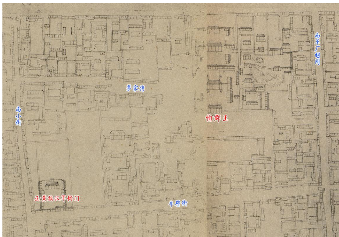
图 2：《乾隆京城全图》中的恂郡王府及周边

允禩晚年曾任正黄旗汉军都统，在《乾隆京城全图》中标有“正黄旗汉军衙门”，就在离他家不远的半壁街上。