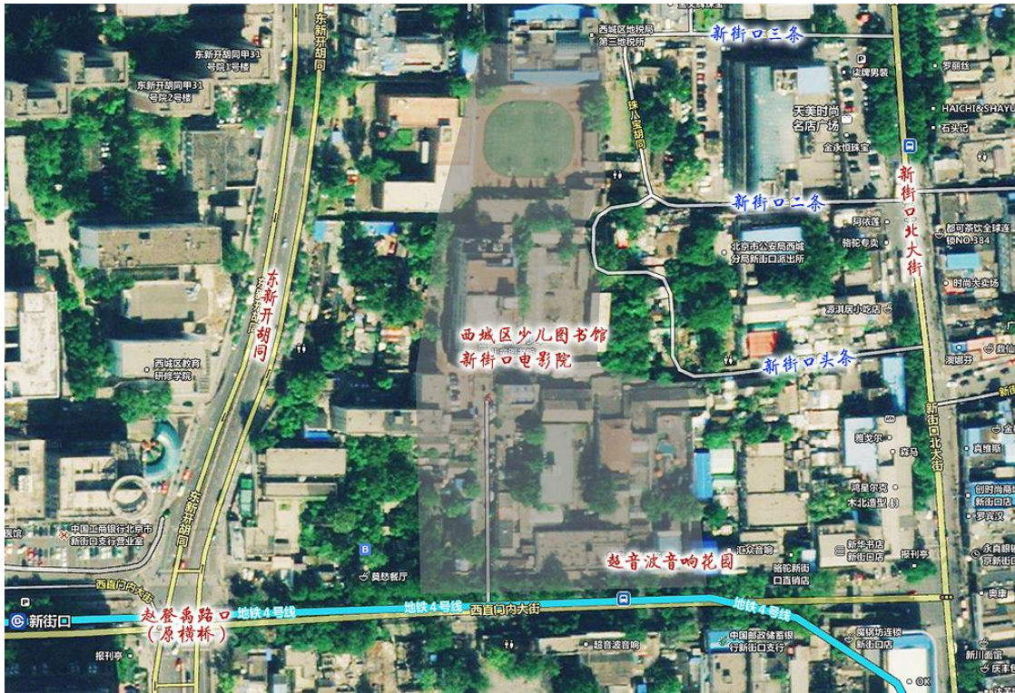
图 3：原贝勒球琳府现在的地理方位

解放后，北京幻灯片厂在这里选址建厂，从 1950 年到 1988 年，存在了近四十年，之后又改建成超音波音响花园。现在的“贝勒球琳府”早已灰飞烟灭，原址上除了音响花园及新街口电影院、西城区少儿图书馆外，一些老平房正在拆迁。不久的将来，这里又会是另一番景象。