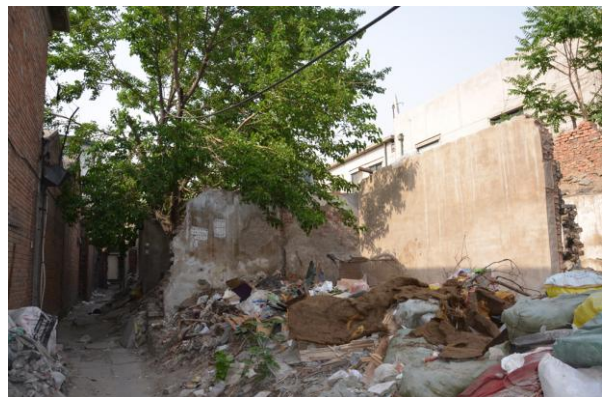
图 4：音响花园周边正在拆迁的老平房