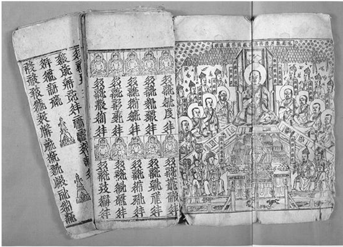
元刻本西夏文《现在贤劫千佛名经》

据史籍记载，两千年前纳西族的祖先就生活在云南、四川交界的金沙江流域，具有悠久的历史 and 丰富多彩的民族文化。纳西族原有四种文字，即东巴文、哥巴文、阮可文和玛萨文。已有 1000 多年历史的纳西东巴文是当今世界上唯一仍在使用的象形文字。纳西族东巴教经书大多用象形文字写成，故得名一东巴经。