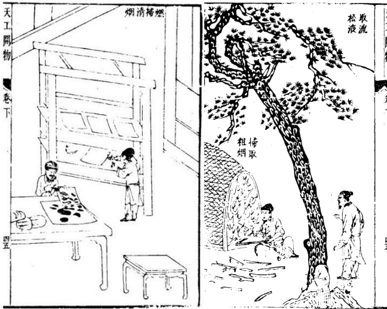
《天工开物》中所载制墨过程

传拓用墨有许多种，最基本的是松烟墨和油烟墨。松烟墨用油脂多、枝干粗壮的古松烧出的烟食作原料，经过燃松取烟、采煤、漂烟、筛烟、去除杂质、配胶、用药、杵捣、制丸等步骤制成。其墨色浓而无光，质细易磨，用于传拓别有一番墨韵。油烟墨即用桐油、麻子油、皂青油、菜籽油等烧烟所制之墨，墨色坚而有光，黝而能润，其拓片纯黑而有浮光，是目前传拓用墨中较普遍的一种。