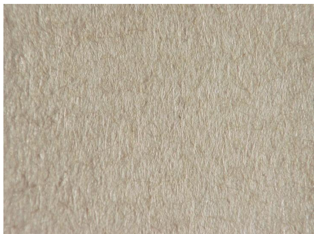
三十倍显微镜下的绵连纸、 毛竹纸纤维图