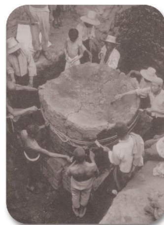
YH127 坑甲骨灰土柱整体出土

值得一提的是，1936年，在第13次殷墟科学发掘中，小屯村北YH127坑发现17096片甲骨，震惊世界。整坑甲骨起运装箱，从小屯运往南京，经过整理粘对后，合成整版的共有320多版，半完整和接近半完整的有520版。这些甲骨记录了武丁时期的许多重大活动，是武丁王室的珍贵档案。该坑甲骨数量巨大，有甲多骨少、契刻卜兆、朱书墨书、涂朱涂墨、改制背甲、特大龟甲等特点，在甲骨学史上有着重要的意义，颇受学术界关注。