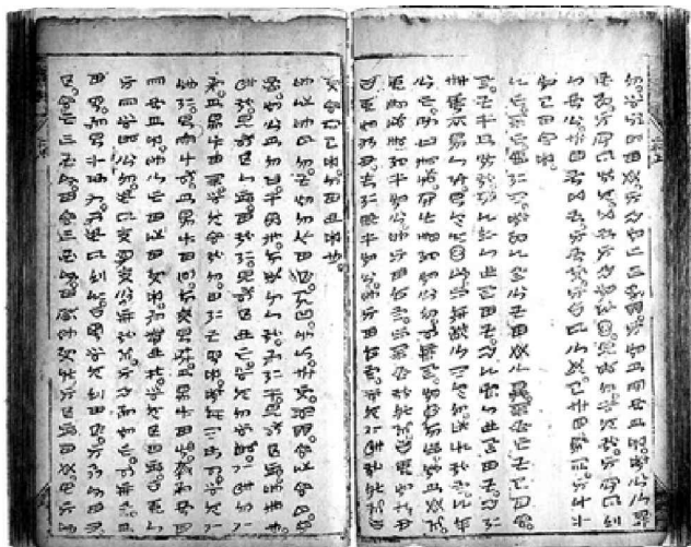
明刻本彝文《太上感应篇》

国家图书馆珍藏的古彝文典籍共有 589 册，其中 500 多册是马学良、万斯年先生为国家保留彝文典籍，在抗日战争时期到云南武定县慕连乡那安和卿土司家以及武定禄劝一带彝区收集的。当时法、英、德、美等国的所谓“文化人”都对古彝文典籍垂涎三尺，妄图以高价争购。深入彝区进行社会考察的马学良先生获悉那土司有出售家藏古彝文典籍之意，恐被他们掠走，使之流散国外。于是一面劝那土司深明大义，不要售与外国人；一面向国立中央研究院历史语言研究所傅斯年写信，请求所里购置。因所里经费不济，傅先生即转告国立北平图书馆。图书馆于 1943 年 6 月派万斯年先生前往征购。从万斯年先生到武定和马学良先生共同研究审订，断定那土司收藏的彝文典籍是研究彝族言语文字、社会历史、文化教育、以及民族关系的宝贵资料，确有特殊的学术价值，到交涉筹款取得那土司的同意，办完图书移交手续，前后经过一年多的时间。507 册彝文典籍，当时计价法币 20 万元，那土司只收 9 万元，余 11 万元作为向国家捐赠，为此教育部向那土司颁发一等奖状，以示褒奖。其余的几十册是 80 年代请人协助先后从彝区采购的。