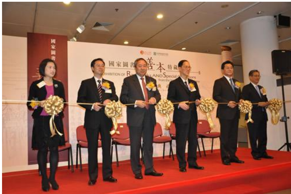
（图为开幕式剪彩现场）

2011年12月8日，“国家图书馆善本特藏展”在香港中央图书馆隆重开幕，展出国家图书馆的善本古籍、碑帖拓本、古旧舆图、少数民族文字古籍42件。国家图书馆馆长、国家古籍保护中心主任周和平出席了开幕式并致辞，中央人民政府驻香港特别行政区联络办公室副主任李刚、香港民政事务局局长曾德成、香港公共图书馆咨询委员会主席梁智仁、香港康乐及文化事务署署长冯程淑仪出席开幕式并剪彩，部分外国驻港领事代表及图书馆界专家、学者百余人参加了开幕式。展览期间，周和平还以“保护古籍、传承文明”为题，面向公众举办了专场讲座。周和平从中华古籍的意义、保护中华古籍的必要性与近年工作成绩、国家图书馆与香港文化机构推动古籍保护合作等方面进行阐述。该展览于2011年12月8日至2012年1月15